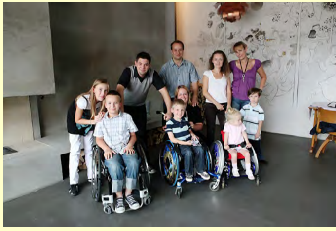
SMA-Kinder und -Geschwister & Tim Mälzer

Eine überaus beeindruckende Veranstaltung war der SMA-Ballett-Abend im Aalto-Theater Essen im Juni. Es kamen über 14.000 € für den guten Zweck zusammen.